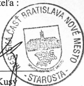
Mgr. Rudolf Kusý starosta mestskej časti Bratislava – Nové Mesto