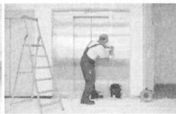
Servis 24 hodín