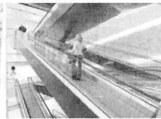
Eskalátory & pohyblivé chodníky